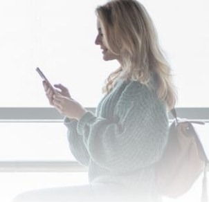
Tableau des garanties

Les montants ci-dessous s'appliquent sous réserve des exclusions de garantie et des termes et conditions stipulées aux Conditions Générales et aux Conditions Particulières.